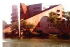
Dirección General de Bibliotecas UANL